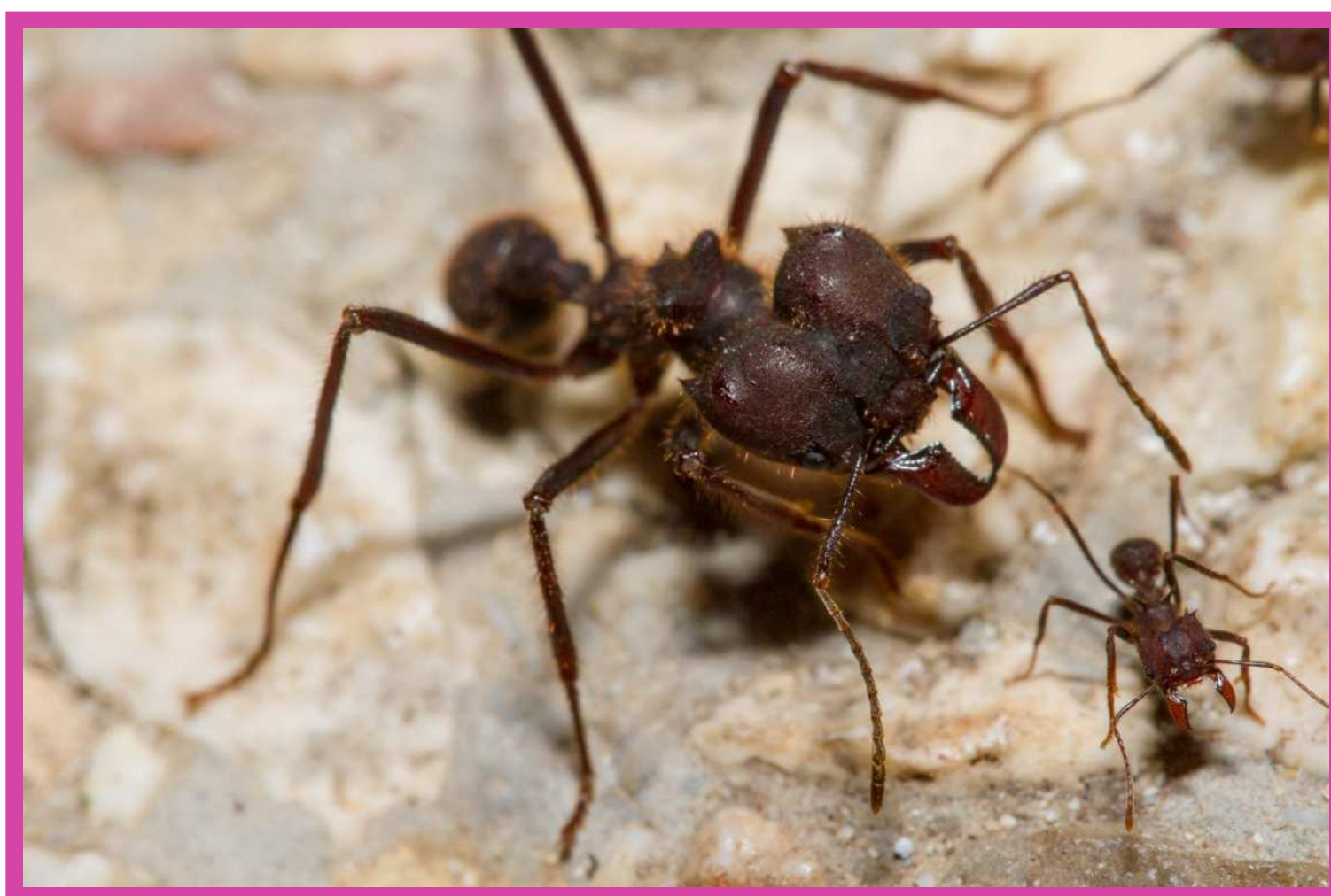
Figura 3. Dos hormigas obreras de la misma especie, una soldado (la grande) y una exploradora (la pequeña).

Con más de 15,000 especies descritas, las hormigas varían en absolutamente todos los aspectos imaginables. Entre las especies, una colonia puede tener desde 10 individuos o alcanzar los 100 millones de individuos, y las colonias pueden tener una sola reina reproductora mientras que otras llegar a tener docenas de ellas. Las reinas pueden vivir unas cuantas semanas o hasta 30 años, las que pueden aparearse con un macho o con docenas de machos (y guardar el esperma de todos ellos para fertilizar sus huevos). También en las colonias puede haber sólo una reina y obreras, o una reina y muchas 'castas' distintas de obreras (Figura 3).