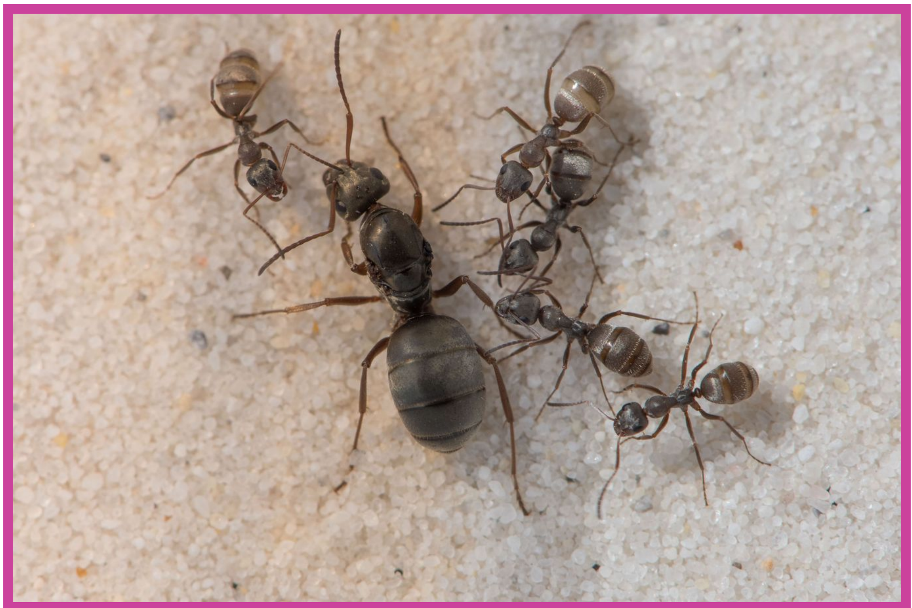
Figura 6. En la hormiga plateada Alpina, Formica selysi , hay colonias con una sola reina, y colonias con muchas reinas. La imagen muestra a una reina (hormiga grande) con sus hijas-obreras (hormigas pequeñas).

Investigaciones recientes en el INECOL evaluaron si existen supergenes en algunas especies de hormigas , y si éstos directamente determinan la estructura familiar/social (por ejemplo, el número de reinas por colonia), y si determinan además rasgos conductuales, morfológicos, y fisiológicos de los individuos producidos por esas colonias. Con una serie de experimentos detallados y con métodos novedosos de investigación, incluido un molino de vuelo para hormigas, se ha encontrado que, en la hormiga Alpina plateada Formica selysi (Figura 6), un cromosoma social que evolucionó hace más de 20 millones de años, determina tanto el número de reinas de la colonia (una reina o muchas reinas por colonia), y aspectos conductuales, fisiológicos y morfológicos. Las reinas y los machos, que son producidas en colonias con una sola reina, son más aerodinámicas, más grandes, con alas de mayor tamaño y más fértiles; mientras que las reinas y machos, que son producidas en las colonias con muchas reinas son más pequeñas, menos fértiles y aerodinámicos.