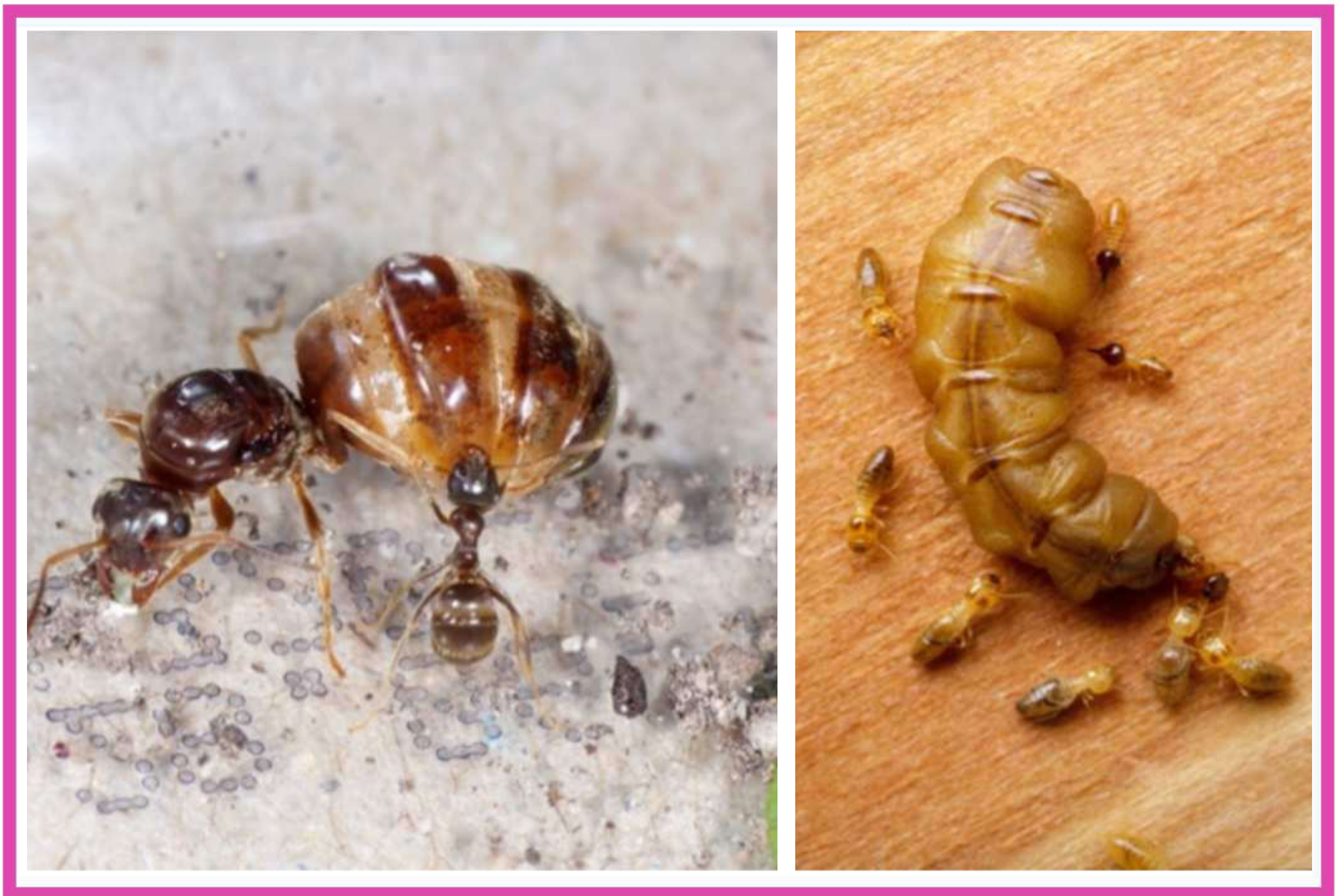
Figura 1. Dos ejemplos de especies eusociales. Del lado izquierdo, una hormiga reina y una obrera de la especie Lasius psammophilus . Fotografía: Volker Borovsky. De lado derecho, una reina con obreras de la especie de termita Nasutitermes exitiosus . Fotografía: CSIRO

Las familias más complejas en el reino animal son las de los insectos eusociales: las colonias de termitas, abejas, avispas, y hormigas (entre otros). Los organismos eusociales se caracterizan por tener miembros del grupo (de la familia) especializados en reproducirse, mientras que otros no se reproducen. Tal es el caso de las reinas de las abejas, y las reinas y los reyes de las termitas (Figura 1).