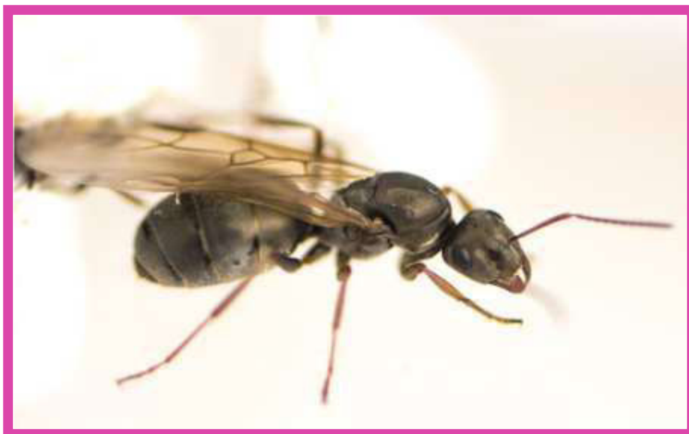
Figura 2. Hormiga reina plateada Alpina con alas ( Formica selysi ).

Con más de 15,000 especies descritas, las hormigas varían en absolutamente todos los aspectos imaginables. Entre las especies, una colonia puede tener desde 10 individuos o alcanzar los 100 millones de individuos, y las colonias pueden tener una sola reina reproductora mientras que otras llegar a tener docenas de ellas. Las reinas pueden vivir unas cuantas semanas o hasta 30 años, las que pueden aparearse con un macho o con docenas de machos (y guardar el esperma de todos ellos para fertilizar sus huevos). También en las colonias puede haber sólo una reina y obreras, o una reina y muchas 'castas' distintas de obreras (Figura 3).